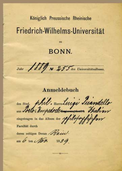
Luigi Pirandello, Libretto universitario, 1889-1891.

Con la lusinghiera lettera di presentazione del suo professore romano si presenta a Wendelin Foerster, insigne professore di filologia romana all'università di Bonn il 12 novembre e inizia a frequentare il primo corso semestrale.